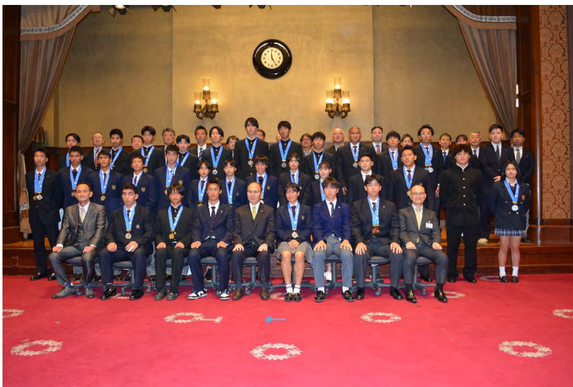
全国大会優勝・準優勝の選手たちが平田副知事を囲んでの記念撮影