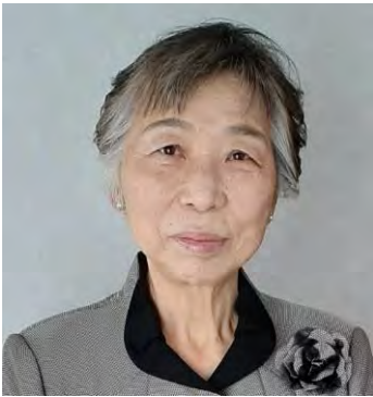
神奈川県スポーツ協会 副会長 神奈川県なぎなた連盟 副会長