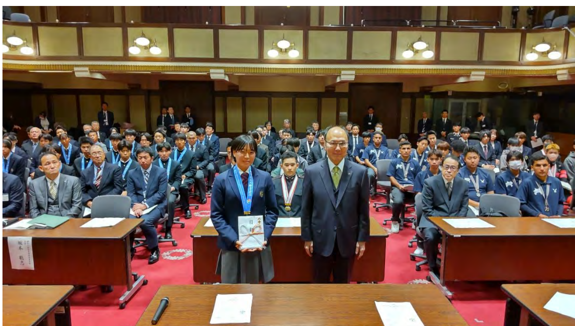
記念品授与 平田副知事から参加者に記念品が手渡されました。