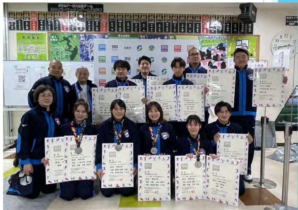
【ボウリング競技】 成年男子・成年女子 神奈川県チーム