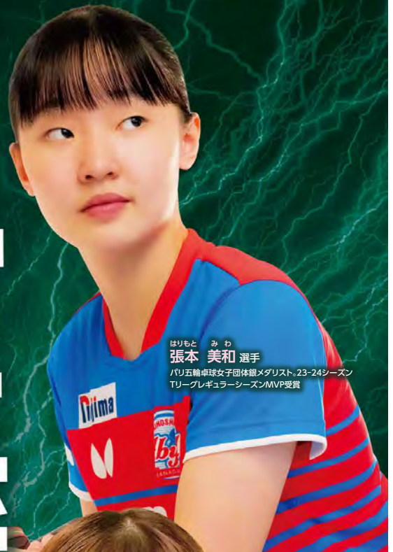
はりもと みま 張本 美和 選手 パリ五輪卓球女子団体銀メダリスト、23-24シーズン TリーグレギュラーシーズンMVP受賞