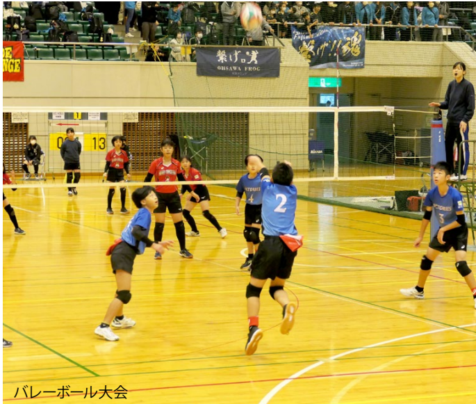
バレーボール大会

私は、小学生の頃、学校のクラブ活動に新しくできた少林寺拳法部に入会したことがきっかけでスポーツを始めました。以来、現在に至るまで、少林寺拳法の修練、指導に明け暮れる日々を送っています。その中で、平成3年（1991年）に相模原市スポーツ少年団の常任委員になり、令和元年（2019年）に本部長を拝命し、子どもたちにスポーツをする喜びやスポーツ少年団の活動から学び得るもの大切さを伝えています。