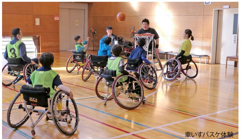
車いすバスケ体験

将来を担う子どもたちの育成を目的として活動しておりますが、新型コロナウイルスの影響でスポーツ少年団活動も自粛が相次ぎ、思うように活動ができない日々が続きました。また、近年の子どもたちは、塾通いやテレビゲームの普及などに伴い、外遊びや運動をする機会が減ってきています。そのような中、子どもたちにどのようにスポーツに親しむきっかけ作りができるか、そしてスポーツの楽しみ、素晴らしさを知ってもらおうか、まずは自分が楽しむ！をモットーに、子どもたちの目線で一緒に汗を流し、地域の特徴を生かした事業の展開を図り、心技体を備えた将来を担う子どもたちの育成に努め、今後も活力あるスポーツ少年団活動を目指していきます。